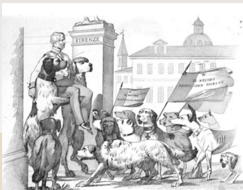
Antonio Masutti, I Nobili Schiavi, in Michelangelo Pinto, Memorie di un italiano a Roma dal 1° settembre 1848 al 31 dicembre 1850, vol. III, Tipografia del Progresso, Torino, 1853, tavola 254, incisione

Una rivoluzione simbolica: iconoclastia e oltraggi politici nel Mezzogiorno di metà Ottocento