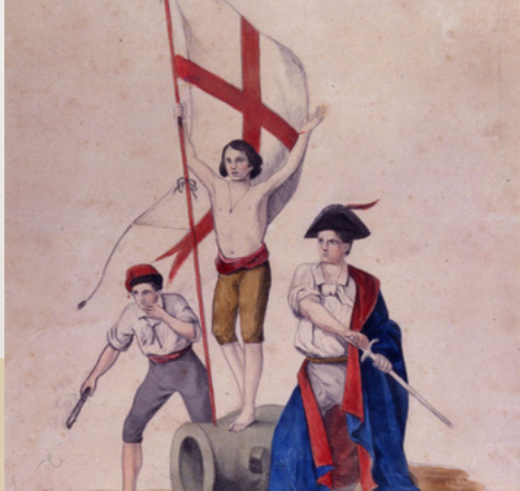
I tre eroi del popolo zeneize, litografia anonima colorata a matita, 1847-48 ca. (Genova, Museo del Risorgimento)

Il 1848 europeo, laboratorio di modernità politica e mediatica